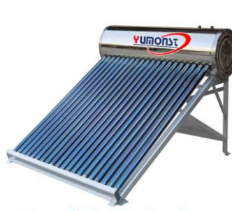
Terma Solar Dual en Acero Inoxidable 200Litros