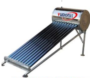
Terma Solar Dual en Acero Inoxidable 100Litros