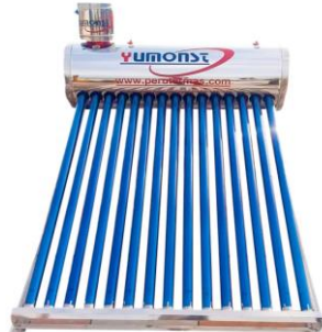
Terma Solar Dual en Acero Inoxidable 150Litros